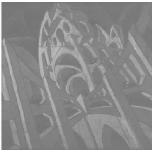
«Edificio visto da un aeroplano virante» de Virgilio Marchi (1919-1920)