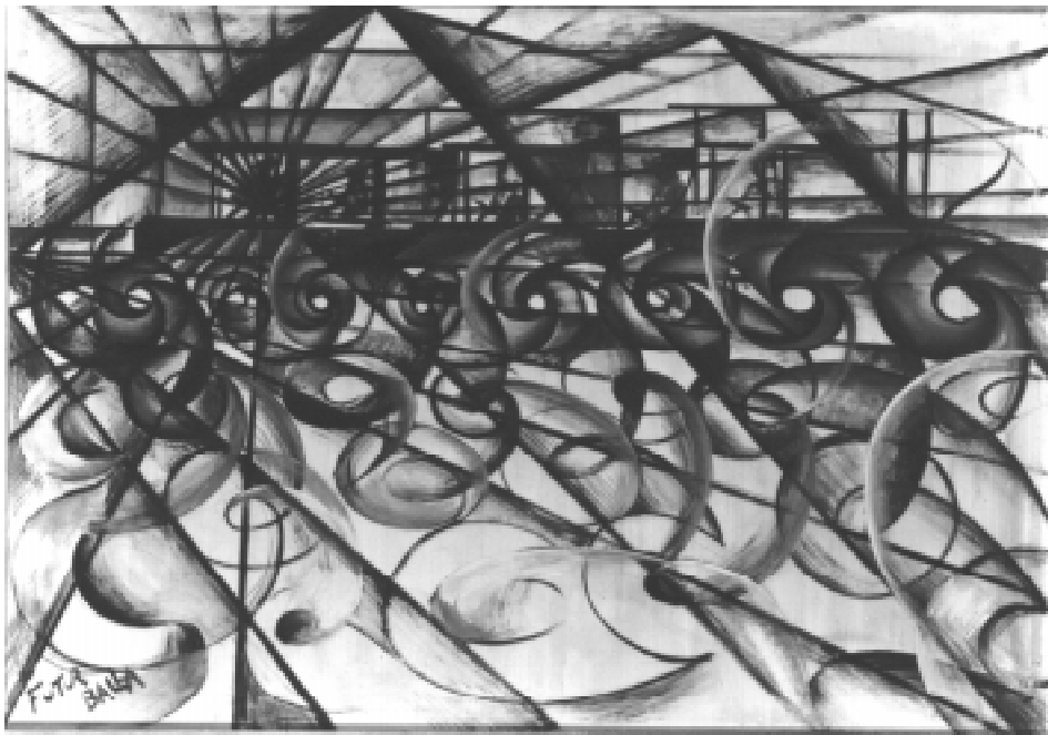
L'un des thèmes récurrents du mouvement futuriste, la vitesse. «Automobile in corsa» (1913-1914), huile sur papier et carton signée Giacomo Balla, en est une illustration.

Après le fauvisme et le pointillisme, et avant d'aborder le surréalisme, la Fondation de l'Hermitage présente cet été une exposition consacrée au mouvement futuriste.