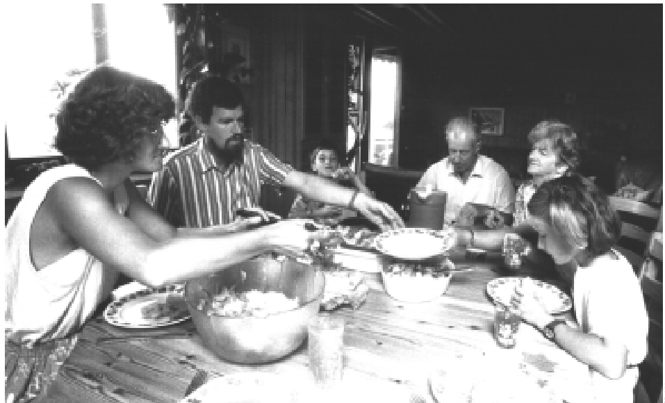
Le travail domestique, éducatif et de prise en charge: des activités reconnues comme expériences professionnelles par la Direction des écoles de la Ville de Berne

En reprenant une activité professionnelle, mères et pères au foyer peuvent faire valoir leur travail domestique comme des années-salaires.