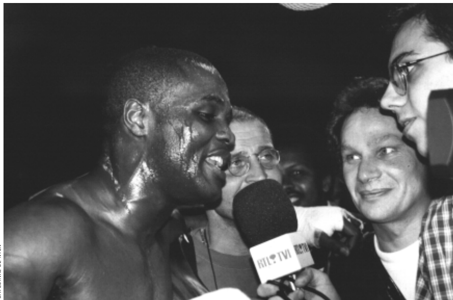
SPFESTIVAL DE NYON

Pour son 30 e anniversaire, le festival nyonnais Visions du Réel met à l'affiche 114 films documentaires. Son programme s'enrichit d'offres culturelles inédites.