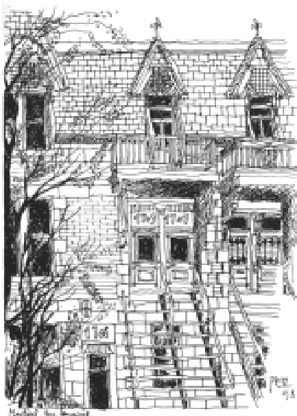
Rue Sanguinet à Montréal.

— C'est bien loin tout ça! Le démantèlement de l'office, la disparition de l'arrondissement. A Berne, un horizon sans surprise et orienté vers l'art de la construction pour la défense. J'ai voulu diriger mon avenir vers de nouvelles actions. A la tête du SB, j'ai retrouvé la même palette d'activités qu'à la Confédération. Comme l'architecture et le patrimoine forment un tout et ont une relation dialectique, je ne peux que me réjouir d'y trouver les monuments historiques et l'archéologie en plus. Ma volonté est de faire reconnaître la valeur du patrimoine immobilier de l'Etat et de créer une architecture du XXI e siècle, qu'il