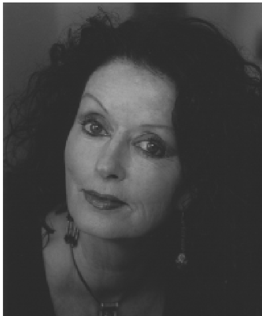
Le Blues d'Alexandrie d'Asa Lanova précipite le lecteur dans les labyrinthes et les sortilèges du port égyptien.

Cette singulière recherche renvoie dès lors à l'aspect mystique du roman d'Asa Lanova et au cheminement intérieur de son héroïne livrée aux multiples périls de son errance égyptienne. Et la romancière, mêlant le polar au récit initiatique, n'hésite pas à en-