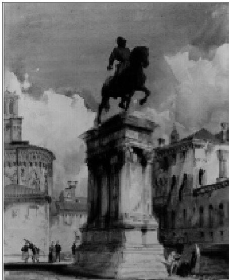
R.P. Bonington, 1826: la statue équestre de Colleoni à Venise.

La prochaine exposition de l'Hermitage offre un panorama complet de l'âge d'or de l'aquarelle anglaise.