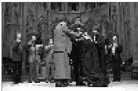
Consécration de pasteurs à la Cathédrale de Lausanne.

«Etes-vous globalement satisfait-e de votre situation dans l'EERV?» Cette question récapitulative terminait le questionnaire. Comme ailleurs dans l'enquête, les répondants se situaient sur une échelle allant de 1 (pas du tout satisfait) à 6 (tout-à-fait satisfait). La moyenne est de 4,2. Si l'on additionne les «plutôt satisfaits», «satisfaits» et «tout-à-fait satisfaits» on atteint un taux de 78% de répondants. Ces chiffres sont bons; d'autant plus que l'enquête a été réalisée au plus fort des turbulences