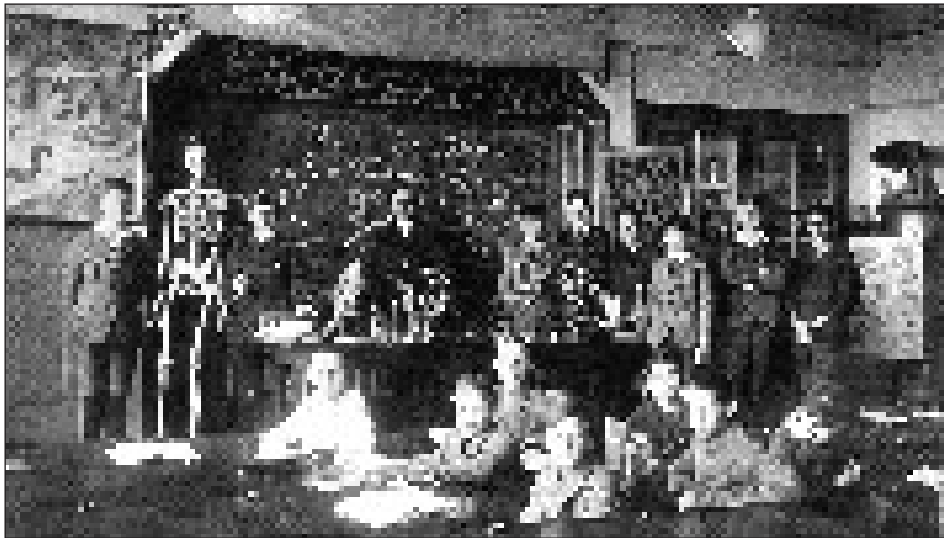
Une classe de 1910.

«Vive les vacances, plus de pénitences, les cahiers au feu...». Des flammes qui font frémir l'Association du Musée des écoles et de l'éducation, qui depuis vingt ans sauve de l'oubli et de la destruction des milliers d'objets liés à l'école, du fameux cahier en passant par le bec à plume ou le mobilier scolaire.