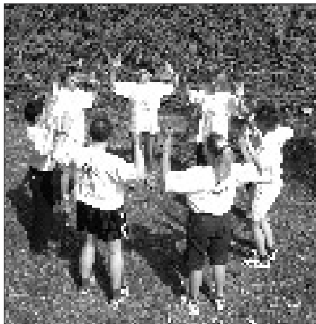
L'association «Allez Hop» tiendra un stand d'information sur des cours d'aqua, de marche dynamique et de gymnastique quotidienne à faire à la maison ou sur son lieu de travail. Elle organisera d'autre part des activités frisbee pour les enfants ainsi que des courses d'orientation et des démonstrations de marche rapide.

Répartis sur les terrains de sport de l'Université de Lausanne et de l'Ecole polytechnique fédérale de Lausanne, une vingtaine de stands proposeront une information ludique, interactive et spécialisée à tous ceux qui souhaitent arrêter de fumer et améliorer leur qualité de vie en bougeant plus. Et puisque depuis 2 ans maintenant, le Cipret met en place un programme de protection des non-fumeurs au sein de l'administration, il a réservé