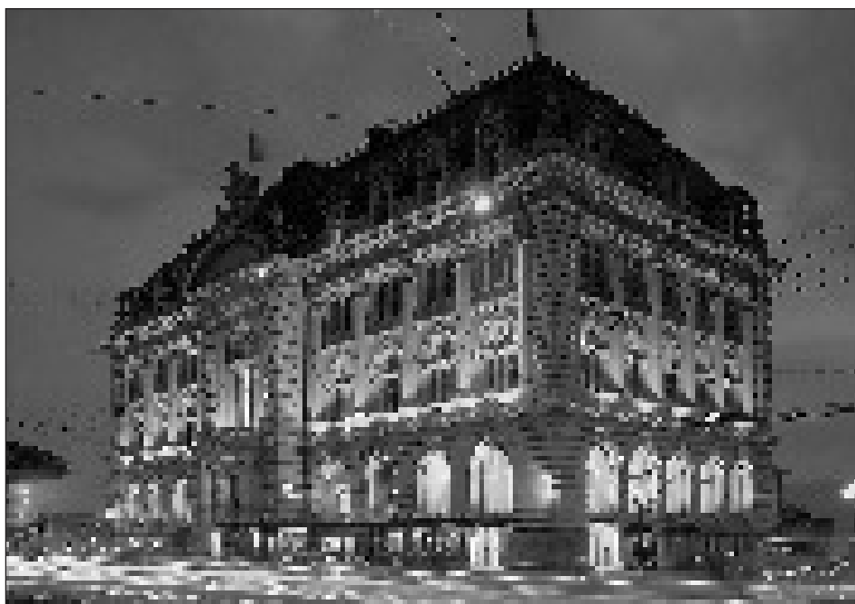
Banque cantonale vaudoise, place Saint-François, Lausanne.