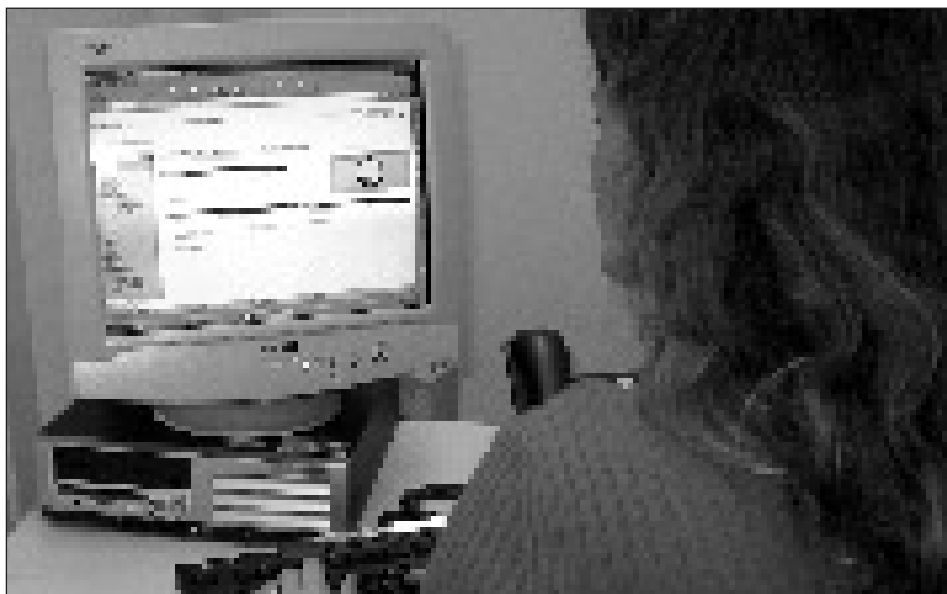
Le projet RADEO vise à permettre à tous les collaborateurs des directions des établissements scolaires de travailler avec des ordinateurs aux standards de l'Etat et connectés au réseau cantonal vaudois.

Dans l'optique de l'application d'EtaCom, le Conseil d'Etat prévoit la création d'un réseau informatique administratif de l'enseignement obligatoire appelé RADEO. Ce projet répond au regroupement des ressources de gestion des établissements, auparavant communales, sous l'égide du Département de la formation et de la jeunesse. Il lui permettra d'homogénéiser ces ressources administratives et de mettre en place une organisation adéquate et opérationnelle à l'échelon cantonal.