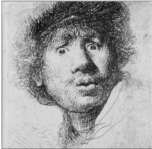
«Tête d'homme avec bonnet coupé» ou «Rembrandt aux yeux hagards», 1630. Alexis Forel voyait en Rembrandt un maître

Une œuvre tardive, dense et prometteuse, trop vite interrompue par la maladie. Incapable dès lors de graver, le Morgien Alexis Forel (1852-1922) devient un collectionneur d'estampes éclairé qui s'entoure d'eaux-fortes de Rembrandt, Dürer, Goltzius, Millet ou Corot. A découvrir au Cabinet cantonal des Estampes