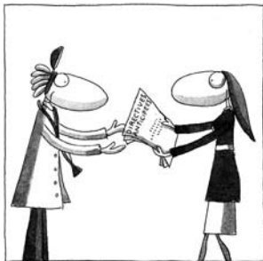
Transmission de directives anticipées.