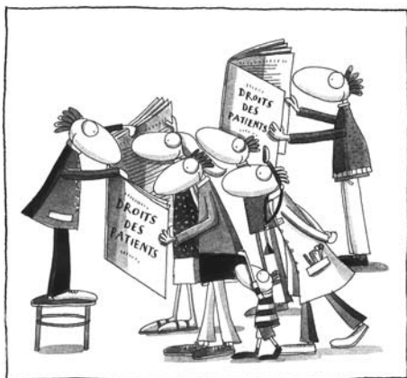
Les illustrations de la dessinatrice Haydé donnent une touche d'humour aux sujets sensibles traités dans les 2 brochures.