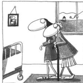
Droit à être accompagné.