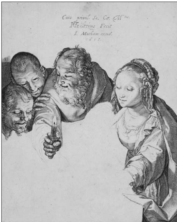
«L'Adoration des bergers», 1601, Hendrick Goltzius. L'une des dernières gravures de l'artiste qui ensuite se consacrera à la peinture.

La Collection Alexis Forel. Une histoire de la gravure du XVIe au XIXe siècle. Cabinet cantonal des Estampes, Musée Jenisch, Vevey. Visites guidées: 26 juin, à 18h et 20 août, à 20h. Ma-dim: 11h à 17h30. Jusqu'au 14 septembre. Second volet de l'exposition: «L'œuvre gravée d'Alexis Forel. Rétrospective.» Musée Alexis Forel, Morges, du 9 octobre au 30 novembre.