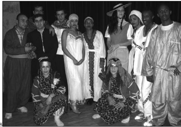
Les requérants qui ont animé le Noël du DIRE par des danses éthiopiennes et kurdes.

Les élèves du service des formations de la Fareas ont reçu leurs diplômes le 18 décembre. Les participants du Noël du DIRE ont pu découvrir les talents de plusieurs d'entre eux.