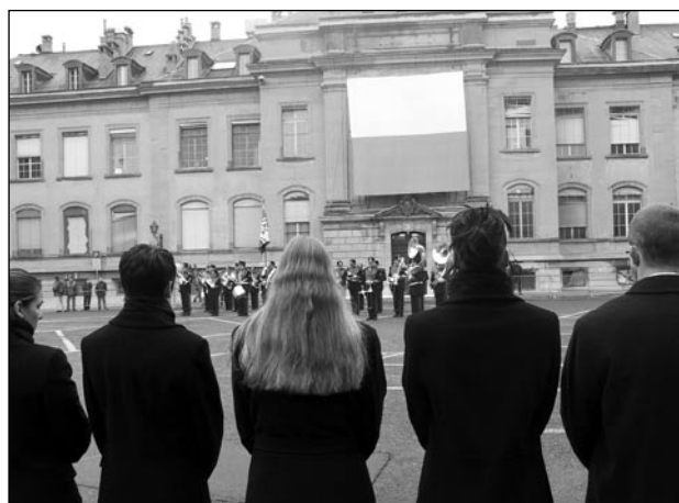
Parmi les nouveaux policiers assermentés, 5 agents de sûreté, qui ont vécu une cérémonie en fanfare et en costume avec notamment la parade des milices vaudoises composées de tambours, de sapeurs et de mousquetaires.