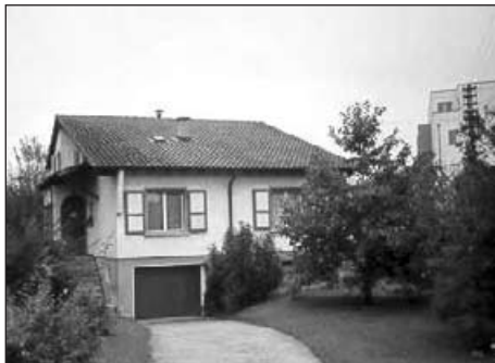
Parmi les cures concernées, celle de Villars-Burquin (à gauche) et celle d'Yverdon-les-Bains.