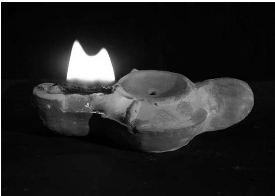
Lampe à canal, en terre cuite, fin du 1 er siècle. Une lampe novatrice née en Italie, particulièrement appréciée et qui se répandra rapidement autour du bassin méditerranéen. Victime de son succès, elle se déclinera en de nombreuses copies de contrefaçons.

Une fois la nuit tombée, comment l'homme de l'Antiquité se débrouillait-il pour y voir dans l'obscurité?