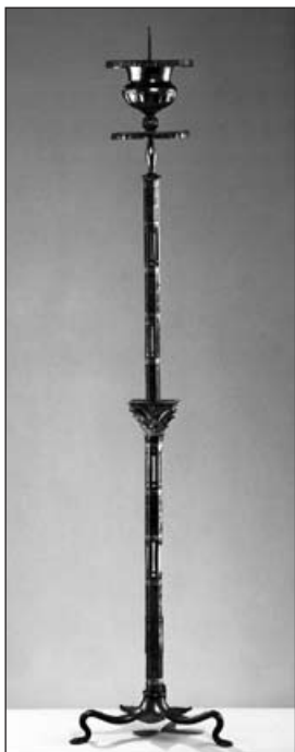
Candélabre en argent, provenant de Kaiseraugst, qui portait une mèche plongée dans la cire, une matière utilisée lorsque l'huile d'olive était trop difficile à se procurer et donc chère.

Vacillante et minuscule, une flamme repousse l'obscurité de quelques centimètres, le long de sa mèche. Comment imaginer que des hommes ont pu travailler, manger ou se déplacer, une fois la nuit tombée, à la seule lumière de ces petites lampes en terre cuite? Si l'éclairage artificiel nous permet aujourd'hui d'avoir quasiment les mêmes activités de jour comme de nuit, il en était tout autrement jusqu'à la généralisation de l'électricité.