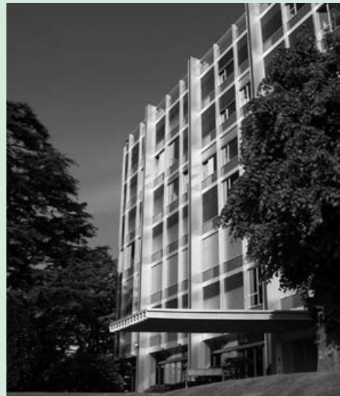
MONUMENTS ET SITES/ÉTAT DE VAUD

Toutes les visites des Journées européennes du patrimoine sont gratuites et les sites accessibles de 10h à 17h, sauf exception. On accède à la plupart d'entre eux sans réservation préalable. Le nombre de visiteurs peut toutefois être limité sur certains sites. Pour tout complément d'informations sur la programmation de