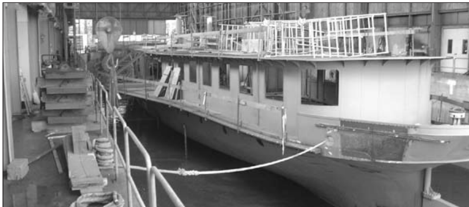
Le bateau «La Savoie» en cours de réfection.