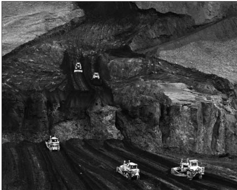
Paysage importé, Islande 2003, par Pétur Thomsen.

Plus que quelques semaines pour voir ou revoir la stimulante exposition de l'Elysée consacrée à 50 jeunes photographes issus des meilleures écoles internationales. Clic clac surprise.