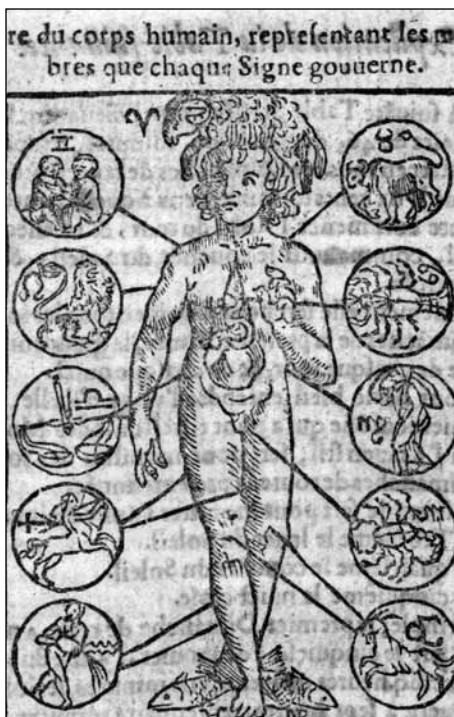
Illustration tirées de livres de médecine anciens appartenant à la collection de l'Institut universitaire d'histoire de la médecine et de la santé publique. «Réduction d'une luxation de l'épaule», selon Ambroise Paré, détail (1579) et «Figure du corp humain représentant les membres que chaque signe gouverne», détail, Almanach de Lausanne, an de Grâce 1662..