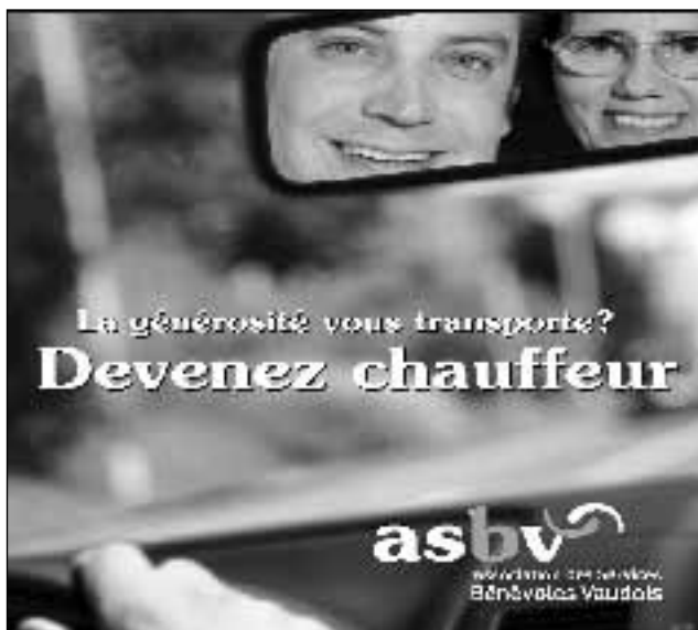
Affiche de la campagne conduite par l'Association des services bénévoles vaudois, visant à stimuler des vocations de chauffeurs bénévoles dans tout le canton et plus particulièrement dans les centres urbains.