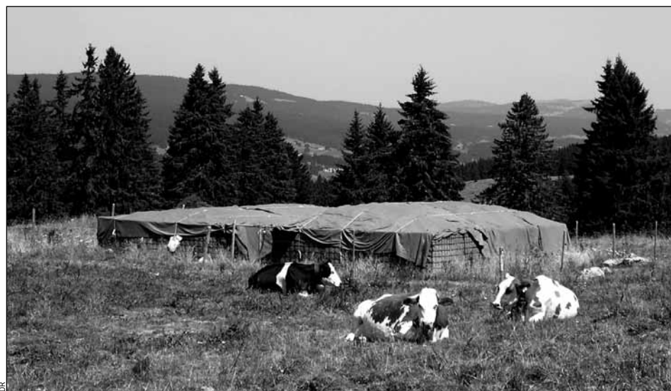
130 vaches paissent sur l'Alpage jurassien des Grands Plats-de-Bise qui produit annuellement environ 25 tonnes de fromage d'alpage. En 2003, les deux tertres imaginés par Jean-Jacques Fiaux ont traité 123 000 litres de lactosérum en 3 mois.

oscille entre 10 000 et 15 000 francs, soit une plus-value de quelques dizaines de centimes à répercuter sur chaque kilo de fromage produit. «Le gros avantage de ces stations réside aussi dans le fait qu'elles ne nécessitent pas d'entretien excepté le changement du compost après 5-10 ans d'utilisation», conclut Jean-Jacques Fiaux qui fut le premier surpris d'avoir été distingué par la Fondation MUT ... ses collègues du SESA l'ayant inscrit sans le lui dire. – AG http://www.dse.vd.ch/eaux/formulaires.htm#publications .