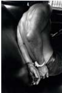
New York, Harlem, 1978

Musée de l'Élysée, Lausanne. Leonard Freed Worldview. L'un des plus grands reporters du 20 e siècle dont les photos ont fait la une de nombreux journaux, Leonard Freed qui vivait par et pour son art est mort en 2006. Visites guidées: dimanches 17 juin, à 16h (par N. Herschdorfer, co-commissaire de l'exposition), 1 er juillet, à 15h et 16h, 5 août, à 15h et 16h et 26 août, à 16h. Cycle de cours: «L'histoire de la photographie en 10 leçons»: La Chronophotographie , dim. 10 juin, à 14h30. Jusqu'au 2 septembre.