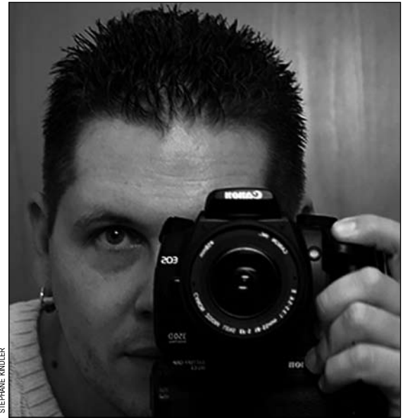
La photographie selon Stéphane Kindler, mille façons de porter un autre regard sur les autres et sur notre environnement.

Le bouche à oreille ricoche. Des jeunes gens le sollicitent qui pour se construire un book, qui pour se faire tirer un portrait aussi esthétisant que différent. Une entreprise lui demande d'illustrer son calendrier 2008 tandis qu'une banque lui propose d'exposer dans deux de ses succursales. Un quotidien lui consacre un article suivi