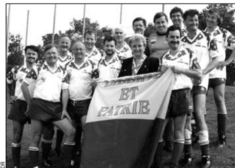
Le football a eu ses heures de gloire à l'État, ici avec l'équipe du Grand Conseil, lors d'un tournoi en 1995.

Imiter les stars de l'Euro, c'est ce que les membres de l'administration cantonale pourront faire le 7 juin 2008, jour de l'ouverture de la très attendue compétition. Un grand tournoi de football à six joueurs est organisé par le Service de l'éducation et des sports. Chaque équipe devra avoir en permanence au minimum deux femmes et deux hommes sur le terrain. Une projection sur grand écran du match d'ouverture Suisse-Tchéquie et un repas cloront cette compétition interne.