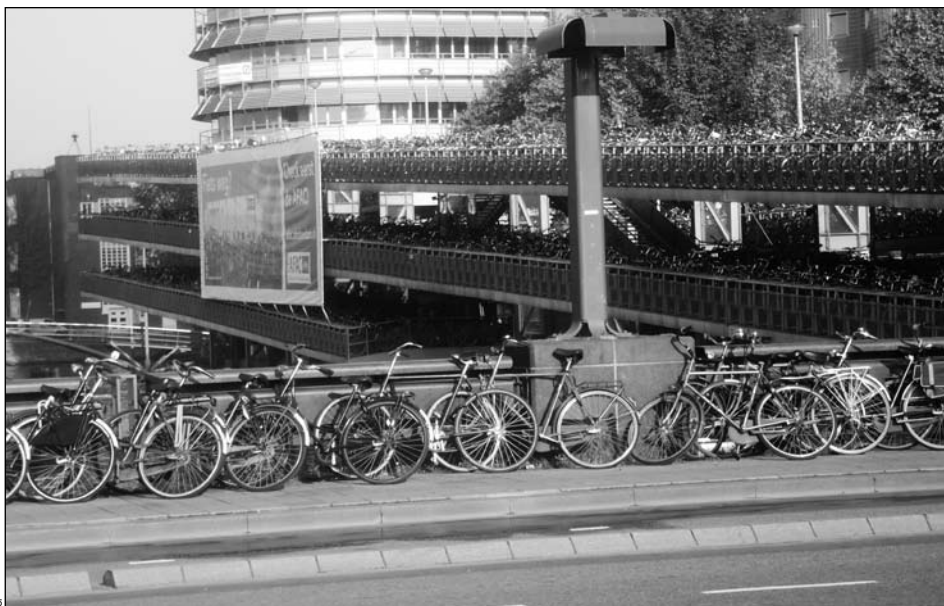
Si tout le monde s'y met et vient à vélo au boulot, les villes vaudoises pourraient bien prendre en juin un petit air d'Amsterdam.

En plus de la convivialité et des effets bénéfiques sur la santé, plusieurs prix seront distribués pour récompenser les efforts de jarrets consentis.