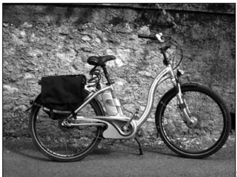
À gagner: deux vélos électriques aux couleurs de l'entreprise lauréate, équipés pour les déplacements professionnels.

Pour la première fois, les administrations publiques (cantonales, communales et parapubliques) pourront déposer leur candidature. Dans un objectif d'exemplarité, plusieurs grandes communes du canton ont développé un projet ou y travaillent. C'est notamment le cas de Lausanne, d'Yverdon-les-Bains, de Pully ou de Vevey. — JAD