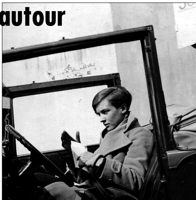
«La maison brûle...elle brûle, nous en souffrons. Toute l'humanité en souffrira», Annemarie Schwarzenbach, Berlin, avril 1933.