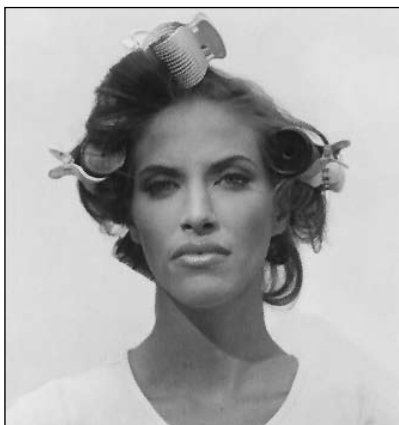
«Femme avec des bigoudis», de Larry Sultan, 2002. Stephen Wirtz Gallery, San Francisco.