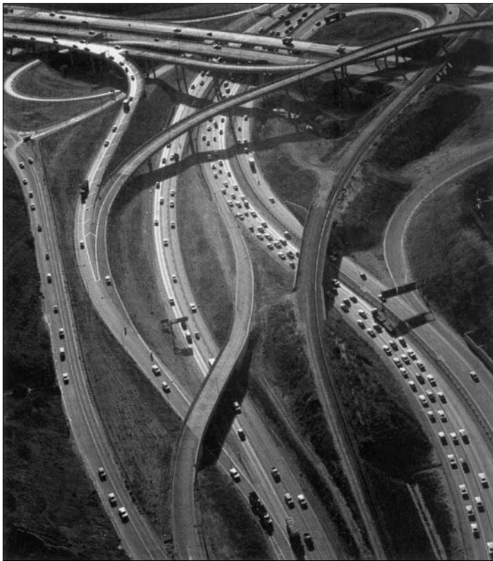
Ansel Adams, «Echangeur d'autoroutes», Los Angeles, 1967. Center for Creative Photography, University of Arizona, Tucson.