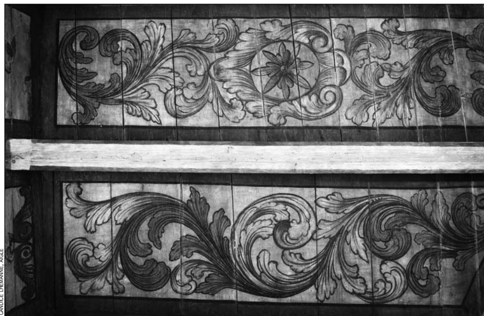
Plafond peint du cabinet de Madame la Gouvernante, XVII e siècle. Des volutes bleues et jaunes qui ont retrouvé leur éclat d'origine.

Au contraire de son illustre voisin de Chillon, dont le site est gâché par un gigantesque parking, le château d'Aigle, reflet du mode de penser actuel, a vu les terres limitrophes être classées en zones protégées afin de lui garder sa fière allure de citadelle, ceinte par les vignes. Annika Gil