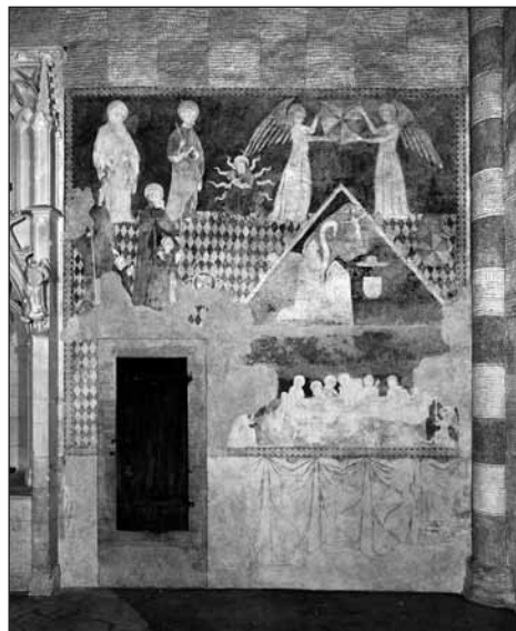
L'un des principaux ensembles de peintures médiévales de Suisse.

Ces pages consacrées à l'Abbatiale de Romainmôtier retracent l'histoire de l'édifice religieux, des origines (les vestiges d'une première église du VI e ou VII e siècle ont été retrouvés lors des fouilles de 1905)