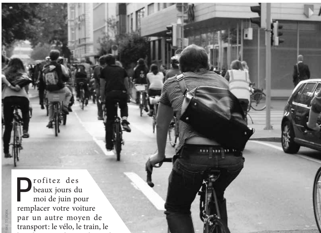
BIKE TO WORK

P rofitez des beaux jours du mois de juin pour remplacer votre voiture par un autre moyen de transport: le vélo, le train, le bus, le métro, la marche ou le co-voiturage. Autant de modes de déplacement pour se remettre en forme et éviter les tracas. Le