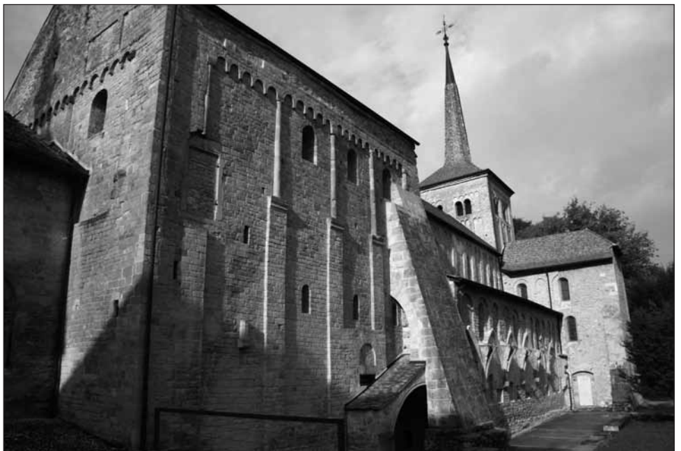
Le massif sud-ouest de l'Abbatiale, avec ses bandes lombardes typiquement romanes, et un imposant contrefort, nécessité par la disparition du cloître, détruit à la Réforme.

à la période faste clunisienne — 500 ans architecturalement et religieusement éclatants — jusqu'à la Révolution vaudoise de 1798, en passant par la Réforme et ses destructions massives. Surtout, elles fournissent une foison d'informations historiques et architectoniques sur l'édifice, détaillant l'intérieur comme l'extérieur de chaque